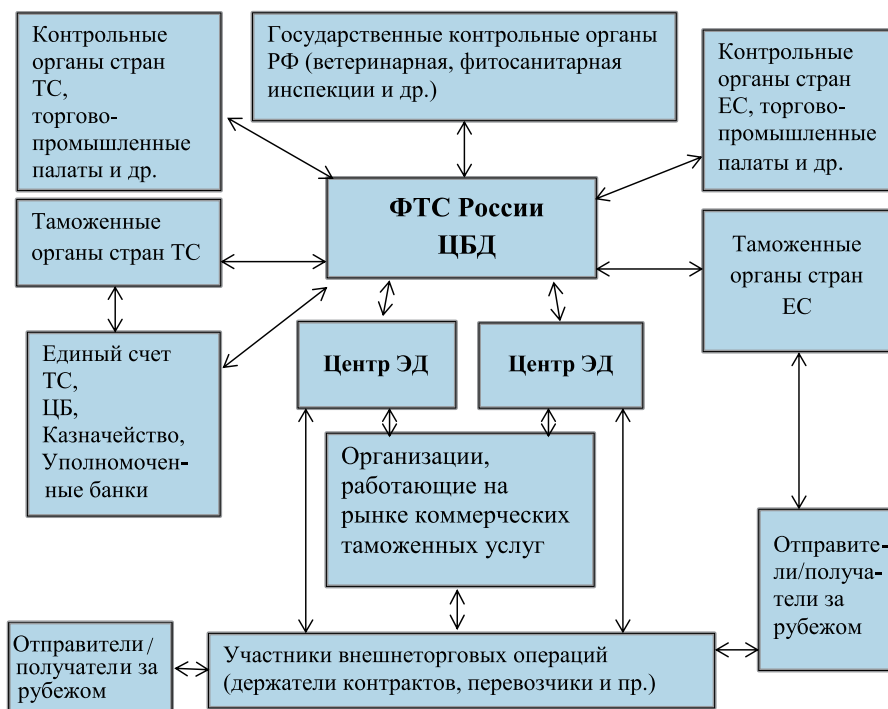
Рис. 3. Перспективная схема формирования информационных потоков в процессе реализации таможенных операций

включая страны Таможенного союза и Европейского сообщества;