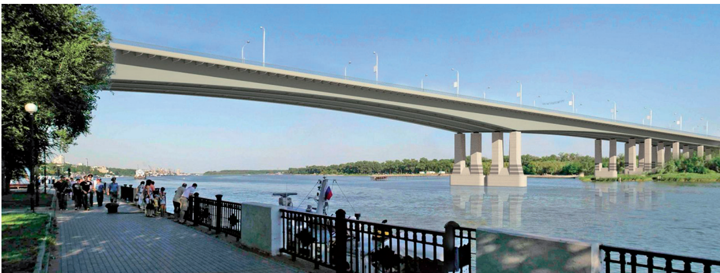
Рис. 3. Реконструкция мостового перехода через р. Дон в створе Ворошиловского проспекта