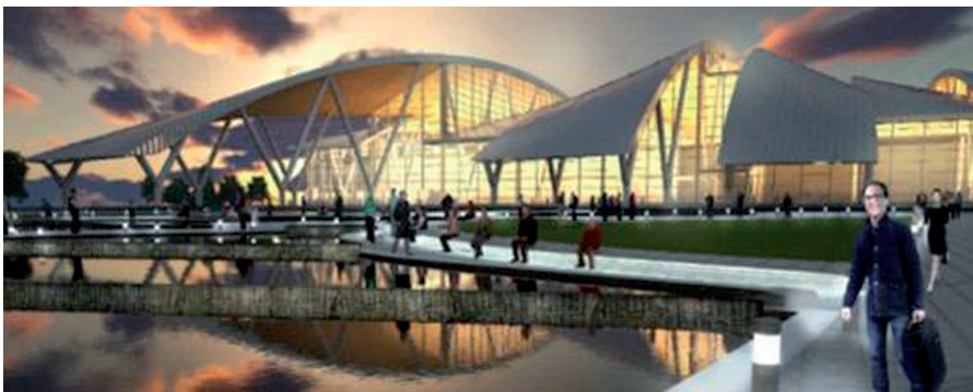
Рис. 2. Архитектурная концепция аэропорта «Южный»