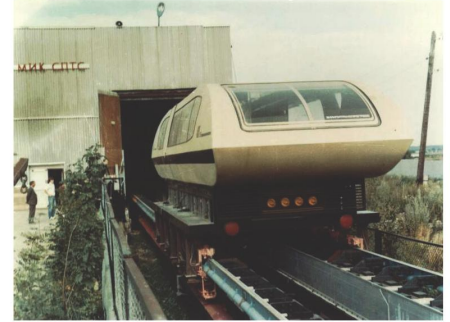
Рис. 6. Вагон ТПО5 – первый в СССР вагон на электромагнитной подвеске с линейным электроприводом (1986 г.)

issues to be solved in evacuated tube transportation // J. Modern Transp. Vol. 19. № 2. June 2011. P. 110–113. Journal homepage: jmt.swjtu.edu.cn