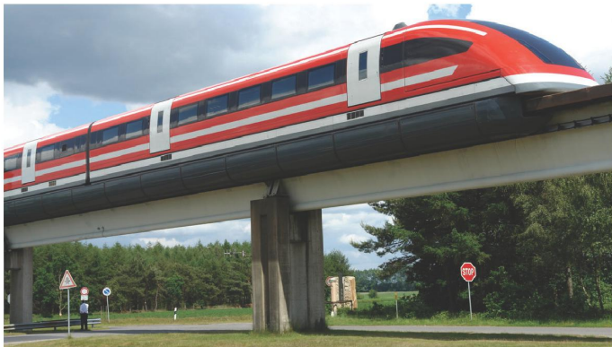
Рис. 2. Электромагнитная транспортная система TRANSRAPID (Германия).