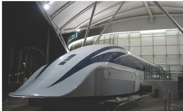
Рис. 3. Подвижной состав L-zero для электродинамической системы.

сделанные на объединенном Ученом совете ОАО «РЖД», подтверждают, что на современном уровне развития техники, материалов и технологий реализация вакуумного поезда крайне проблематична. Критический взгляд на проблему представлен на сайте http://www.warandpeace.ru/ru/analysis/view/118002 .